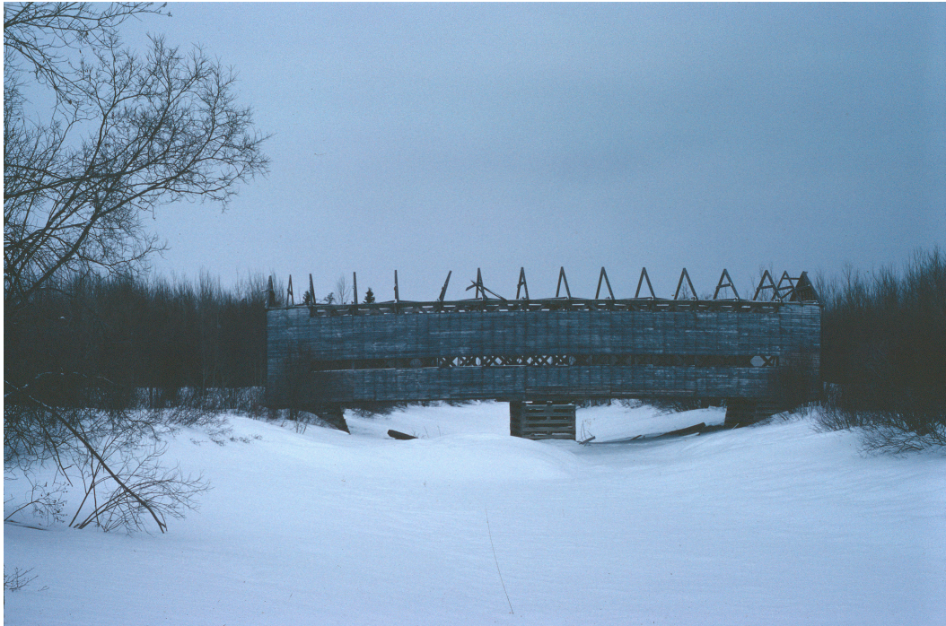
Les dégâts progressent d'année en année. Photo : Gaétan Forest, février 1979.

Une carte thématique annexée à une étude sur les ponts couverts du Québec réalisée par le ministère de la Voirie en 1971 indiquait l'emplacement d'un deuxième pont couvert dans le rang 8 du canton Laas, vraisemblablement sur un ruisseau tributaire de la rivière Laas. Toutefois, l'existence de cette structure n'a jamais pu être confirmée. 7