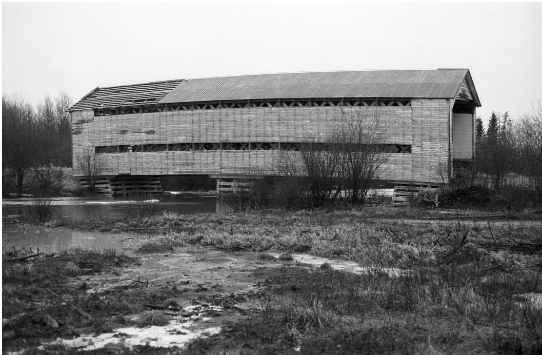
Début du vandalisme sur le pont du canton Laas (61-01-30). Photo : Pierre Duff, 1976.

Un pont couvert enjambe la rivière Laas dans le rang 9 du canton Laas (61-01-30). Réputé être le dernier du Québec, il aurait été construit vers 1958. Toutefois, le réseau routier du canton ayant été complété entre 1950 et 1952, il est plus probable que le pont a été érigé durant la même période. Constitué d'une travée de type Town élaboré, ce pont couvert était typique de son époque, avec ses doubles cordes, ses portiques à angles obliques courts et l'agencement de ses ouvertures latérales. Son pilier central en rivière ne semblait toutefois pas essentiel pour supporter une structure de seulement 105 pieds (32 mètres) de longueur. Peut-être que le devis de construction exigeait une capacité suffisante pour desservir un éventuel transport minier et forestier local.