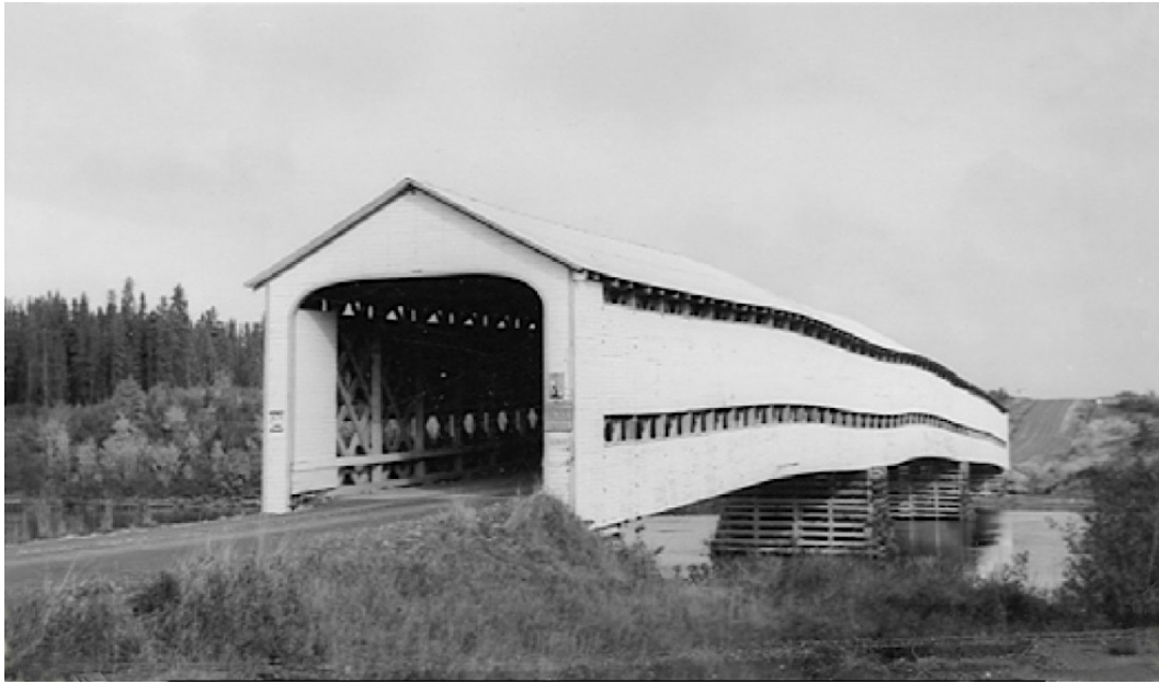
Pont sur la rivière Laflamme, route 64 (397), canton Laas (61-01-23). Photo : L. Dumont, vers 1961. BAnQ 08Y, E23,S1.

Le ministère des Travaux publics a effectué des travaux de réfection sur la structure en 1961. Un ingénieur du Service des Ponts écrivait dans son rapport : « Bien qu'il s'agisse d'un pont dit de colonisation, son importance s'est accrue rapidement vu que la route où il est situé est un des principaux accès à la route de Chibougamau et un trafic très lourd y circule. Il a donc fallu réparer les parties endommagées par le trafic lourd et améliorer sa capacité en renforçant les fermes, en remplaçant et ajoutant des soliveaux et en renouvelant le plancher. » C'est probablement à l'occasion de ces travaux que disparurent les cintres des portiques. Le pont couvert de la route 64 a fait place à une structure bois-acier en 1974. 6