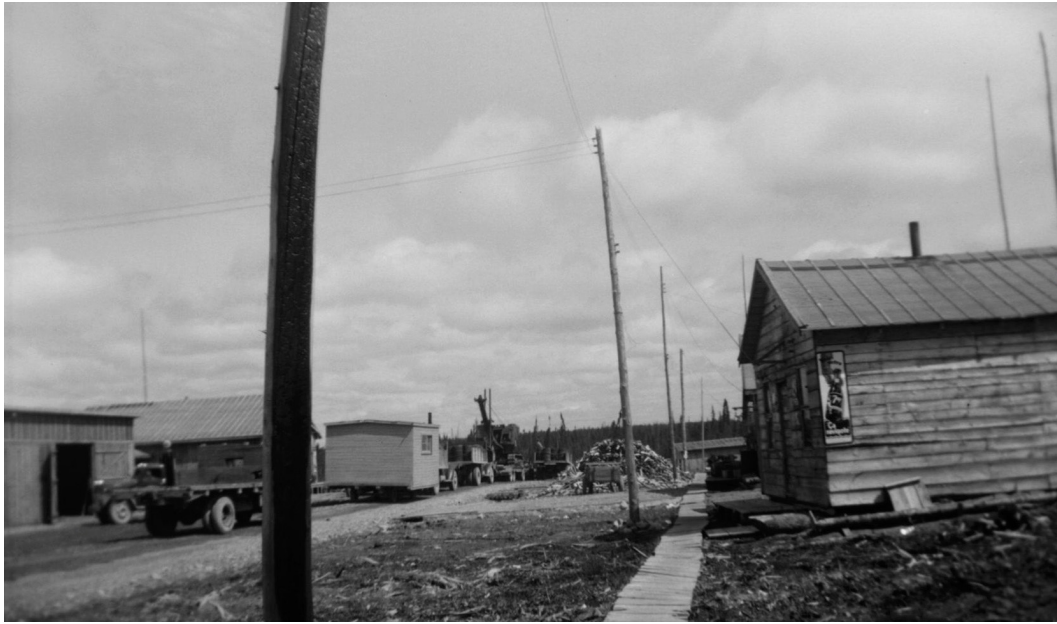
Camp Langlois, canton Laas. Photo : Serge Godbout, 1950. BAnQ E6,S7,SS1,P78441.

Les terres du canton Laas, qui comptaient quelque 228 lots, étaient classées bonnes pour la culture et on prévoyait les ouvrir à la colonisation au printemps 1950. En juillet, le Comité d'établissement rural de la Fédération de l'U.C.C. du Saguenay a demandé au ministère de la Colonisation de mettre le canton à la disposition des cultivateurs du diocèse de Chicoutimi. On visait à en faire une colonie coopérative regroupant quelque cent familles. Les plans de paroisse étaient faits, le Ministère avait construit les chemins dans tout le canton et il se préparait à faire défricher mécaniquement quelques arpents sur chaque lot de ces « rangs doubles », si bien que l'organisation de la nouvelle colonie pouvait être complétée, au besoin, en deux ou trois mois, croyait-on. 4