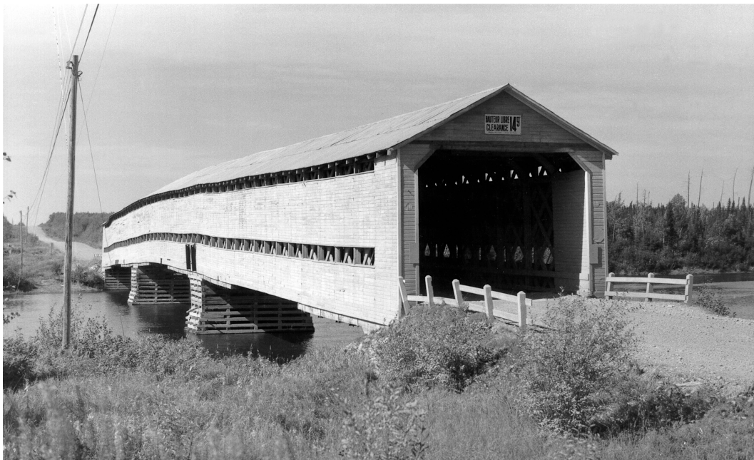
Une hauteur libre affichée de 14 pieds et 9 pouces (4,5 mètres). septembre 1973.

Le ministère des Travaux publics a effectué des travaux de réfection sur la structure en 1961. Un ingénieur du Service des Ponts écrivait dans son rapport : « Bien qu'il s'agisse d'un pont dit de colonisation, son importance s'est accrue rapidement vu que la route où il est situé est un des principaux accès à la route de Chibougamau et un trafic très lourd y circule. Il a donc fallu réparer les parties endommagées par le trafic lourd et améliorer sa capacité en renforçant les fermes, en remplaçant et ajoutant des soliveaux et en renouvelant le plancher. » C'est probablement à l'occasion de ces travaux que disparurent les cintres des portiques. Le pont couvert de la route 64 a fait place à une structure bois-acier en 1974. 6