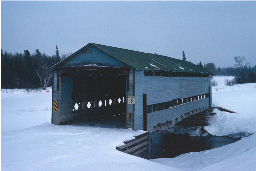
Pont Lavigne (61-01-31) dans le canton Hurault. Photo : Gaétan Forest, février 1979.

« Qu'est-il advenu de la merveilleuse expérience du canton Laas ? » Tel était le titre de l'article de Pierre Vigeant, dans Le Devoir du 29 mai 1956. Cinq ans plus tôt, une délégation, dont le journaliste faisait partie, avait visité le canton Laas sous la pluie, ce qui n'aidait en rien à nourrir l'enthousiasme des visiteurs pour l'endroit. La plupart des routes étaient déjà achevées. Selon le plan de colonisation, la chapelle et les écoles devaient être construites avant l'arrivée des colons. Ceux de Laas devaient être choisis dès l'année suivant la visite, soit en 1952, ce qui ne s'est pas produit. La campagne de publicité vigoureuse, autant que parfois douteuse, du régime de l'Union Nationale pour attirer des jeunes colons n'eût pas l'effet escompté. « La colonisation ne marche plus » écrivait Vigeant dans Le Devoir . Malgré les efforts pour préparer cette nouvelle terre d'accueil, le canton Laas est demeuré tristement désert, sa colonie réduite à l'état de projet sans suite. Tout comme les cantons Ducros et Bartouille, au sud, Hurault à l'ouest et Comtois au nord. Le pont couvert du rang 9 a attendu en vain l'arrivée des colons. Abandonné, mal-aimé, déchiqueté, brûlé à petit feu, il a fini par s'écrouler par pans entiers. Le dernier vestige du rêve utopique de coloniser le canton Laas n'est plus qu'un amas de bois pourrissant. 10